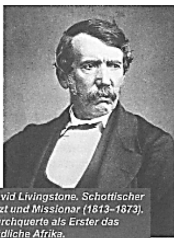
David Livingstone. Schottischer Arzt und Missionar (1813–1873). Durchquerte als Erster das Südliche Afrika.