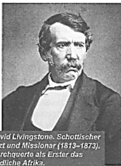
David Livingstone. Schottischer Arzt und Missionar (1813–1873). Durchquerte als Erster das Südliche Afrika.